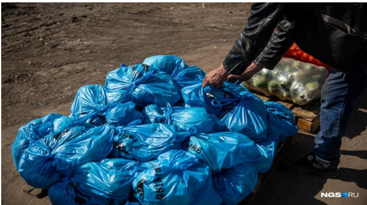
Овощные наборы для нуждающихся новосибирцев формируют заранее и отдают социальным службам.

Пока есть возможность, пока в стране такой трудный момент, поддержим, чем можем. Помогаем нуждающимся и малообеспеченным людям, тем, кто остался без работы. Если мы все соберемся и будем помогать друг другу, будет очень хороший эффект. Знаете, как говорят, друзья познаются в беде. Так мы любую эпидемию и пандемию победим, — говорит Шакир Сулейманов.